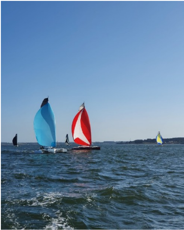
A bord de GOM, quelque part dans la baie

Le premier arrive vers 17h00 quand le dernier est arrivé à 18h40 sur un parcours de 50 miles.