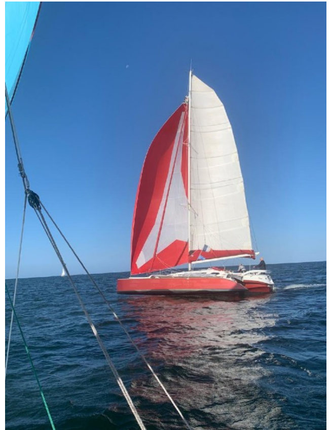
France vu d'Evinrude

Le parcours à la sortie du golfe dans la baie de Quiberon prévoit de contourner le rocher de la Vielle près de l'île d'Houat, puis on retransverse la baie pour virer un bouée devant St Gildas de Rhys.