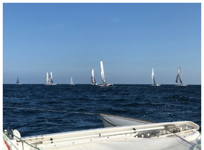
Départ vers Hoëdic, dernier run ensemble !

Dimanche, dernier jour Départ vers 9h15. Toujours soleil et vent.