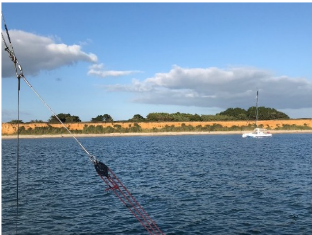
La plage de Pénestin, estuaire de la Vilaine

Nous mouillons sous les falaises ocre-dorées de la magnifique plage de Pénestin nommée plage de la mine d'or.