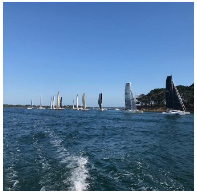
Juste après le départ, la meute de multis double la pointe de Liouse au sud d'Arz à la poursuite d'Evinrude et Ngalawa.