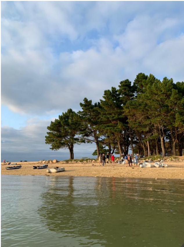
La plage de Brouel à Arz