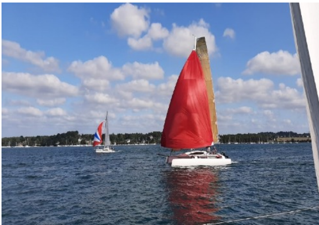
Storm au premier plan et Zoom à hauteur d'Arradon