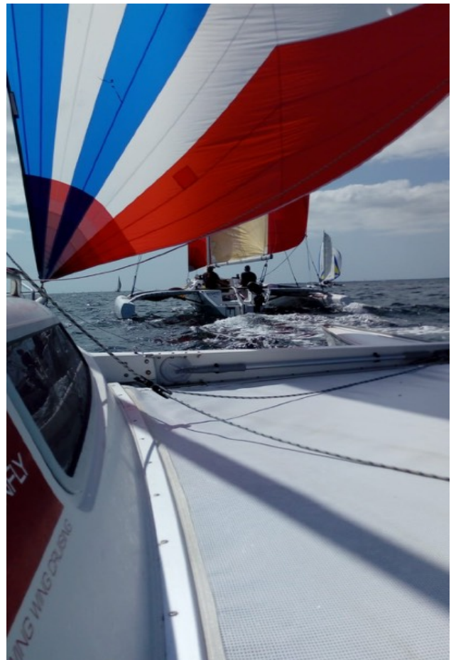
Storm devant Zoom

Le vent mollissant nous envoie quand même de belles rafales de 22nds. Certains participants ont enregistré des rafales de 30nds.