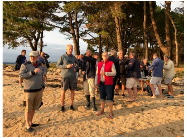
Le pot de l'ATD