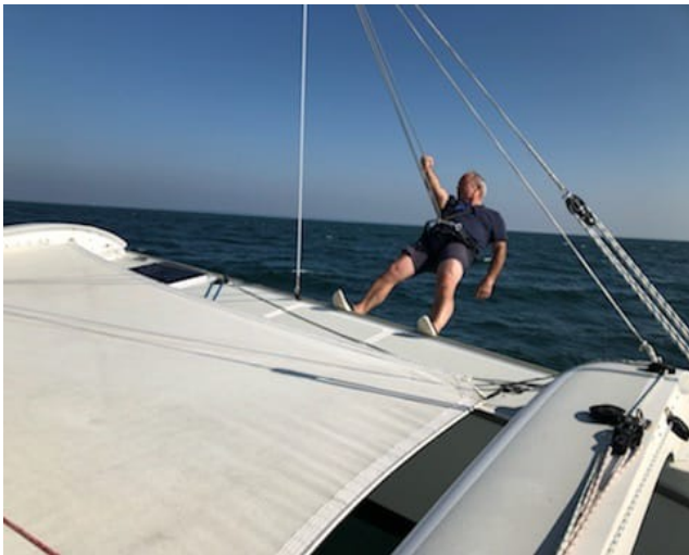
On comprend pourquoi certains arrivent les premiers...

Le premier arrive vers 17h00 quand le dernier est arrivé à 18h40 sur un parcours de 50 miles.