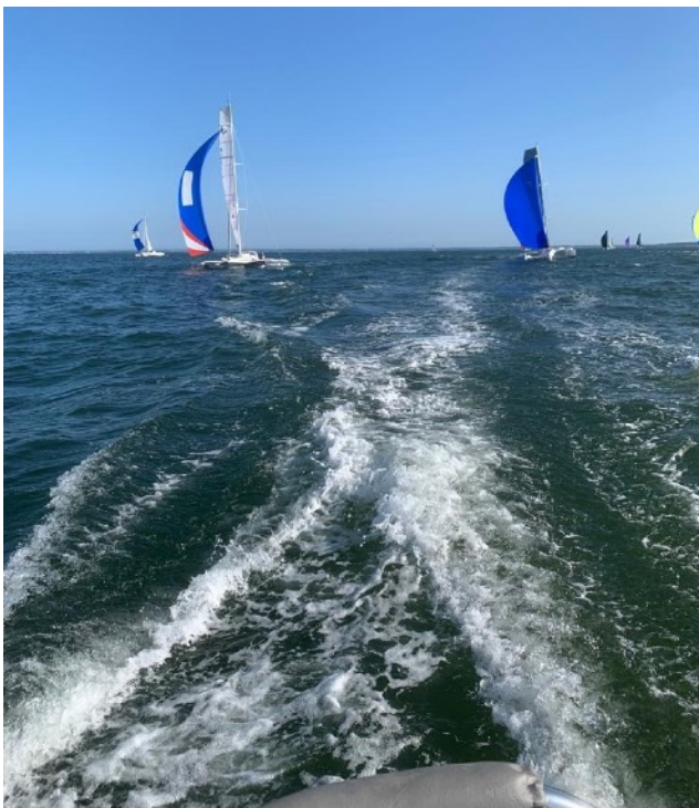
A bord d'Evinrude, quelque part dans la baie