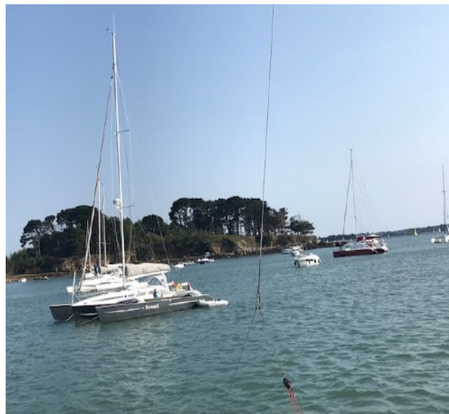
Au mouillage devant Brouel, en arrière plan, la pointe Liouse

temps dans un cadre magnifique, devant la plage de Brouel au sud-ouest de l'île d'Arz.