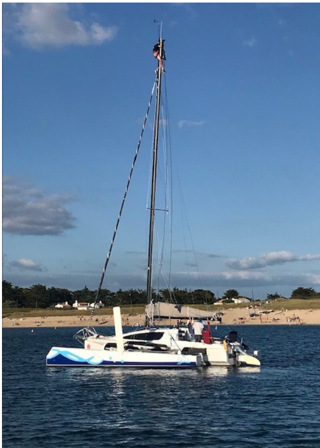
Remplacement drisse de GV pour 3 Bouts devant Luzéronde

L'ambiance de tous les soirs est au rdv. Retour aux bateaux entre 21h00 et 22h30.