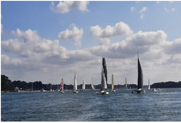
Dans le golf, entre Arradon et l'île aux moines