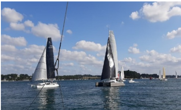
A gauche Unleashead, devant Phistéhau

Le parcours à la sortie du golfe dans la baie de Quiberon prévoit de contourner le rocher de la Vielle près de l'île d'Houat, puis on retransverse la baie pour virer un bouée devant St Gildas de Rhys.