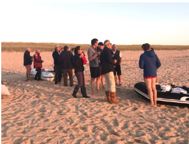
Personne sur la plage de Luzéronde, que nous !

L'ambiance de tous les soirs est au rdv. Retour aux bateaux entre 21h00 et 22h30.